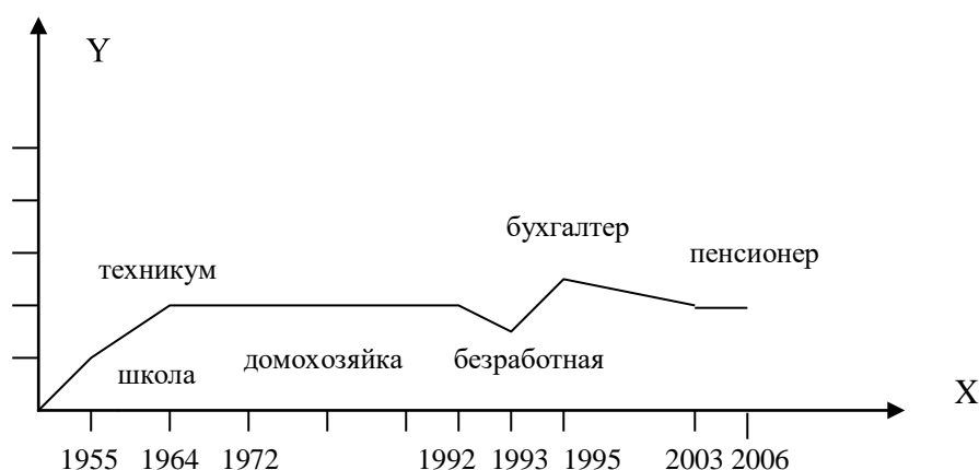
Рис. 1. Динамика статусного портрета члена моей семьи: ось OY — ранг статуса, ось OX — жизненный цикл индивида.

Задание 2. Изобразите статусный портрет члена вашей семьи и его динамику (пример)