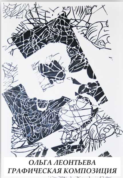
ОЛЬГА ЛЕОНТЬЕВА ГРАФИЧЕСКАЯ КОМПОЗИЦИЯ

- Наш институт каждый год посылает работы на эту выставку-