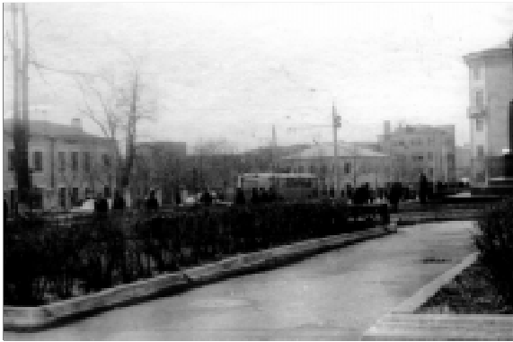
Фото слева: сквер перед зданием на улице Советская, 13. Чуть виден памятник В.И.Ленину, нет еще современной громады Национального Банка УР, нет и елей, к которым мы привыкли. А вот скамейки стояли, сегодня их нет.

Продолжается конкурс фотографий, посвященный 10-летию выпуску КИГИТ.