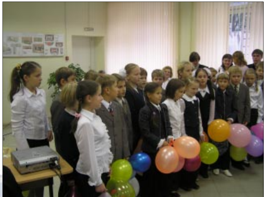
На снимке: ученики 4 «А» класса лицея №41 г. Ижевска поздравляют преподавателей и студентов КИГИТ

Мы желаем вам большого счастья, крепкого здоровья, терпения, творческих успехов и хороших учеников! Хочется отдать дань уважения вашему нелегкому, благородному труду. Педагог, глубоко знающий и любящий свой предмет, не просто передает информацию, он воспитывает Человека – учит его мыслить, ставить вопросы, искать ответы... Мы желаем нашим преподавателям, доцентам, профессорам всегда оставаться на таком высоком уровне!