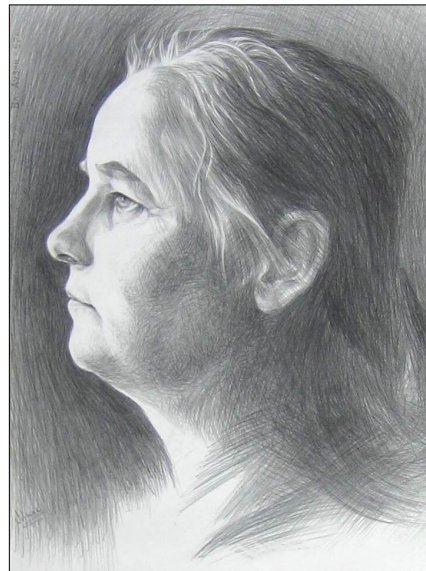
Портрет матери, 2003, б., карандаш

Далее личная инициатива - благотворительная деятельность. Осуществить давнюю мечту – организовать художественную галерею с библиотекой книг по искусству в