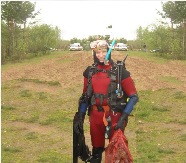
Ну вот опять я вырвал страну...