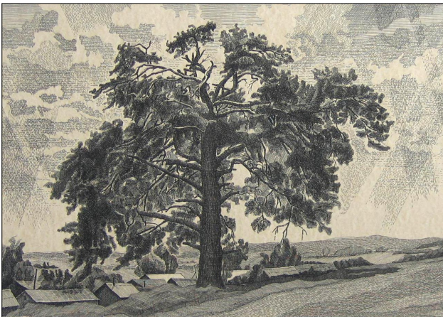
Якшур. Священное дерево удмуртов, 2003, цв.б., тушь, перо

- Да. Ведь я окончил во время службы во Владивостоке школу военных корреспондентов при ре-