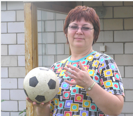
Я тебя не брошу, я тебя уроню!..