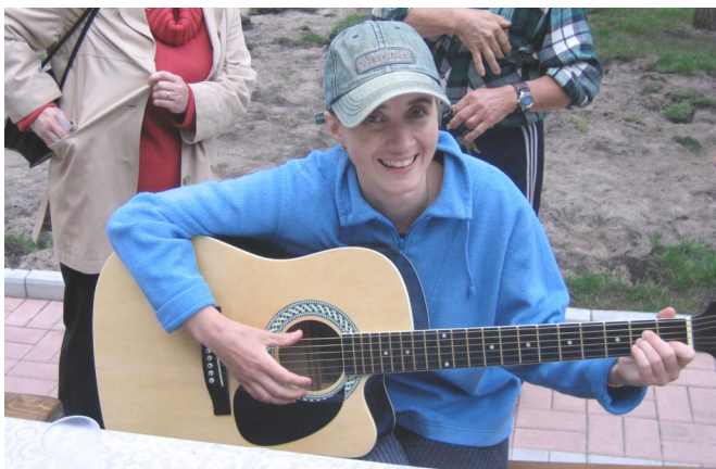
Заслушались, мадам, как Вы молчите...