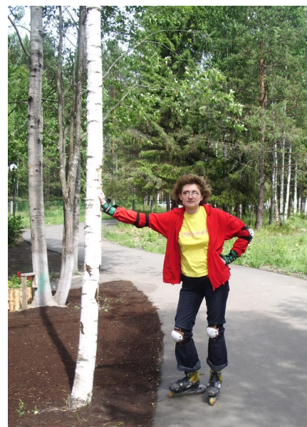
А Вас я попрошу узнать личком...