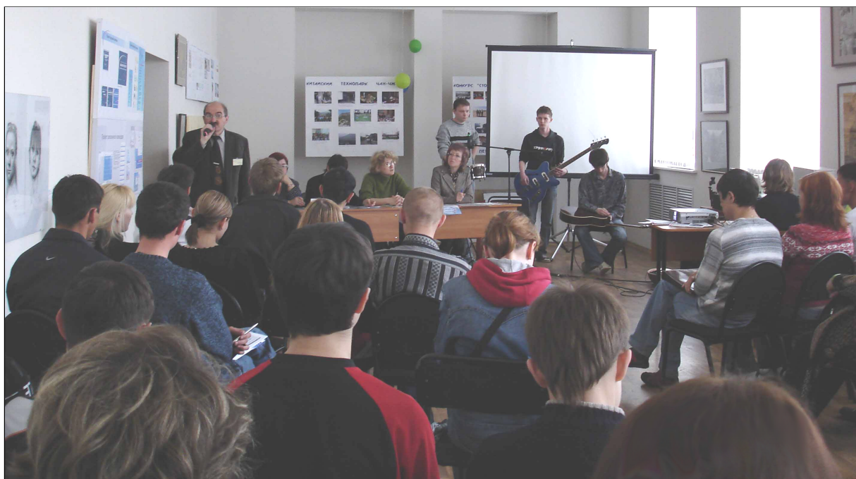
День открытых дверей в КИГИТ

Завершается весенний семестр, а вместе с ним мероприятия по профориентационной работе среди молодежи города и республики, которые традиционно приходится на окончание учебного года в наших школах. Перед выпускниками и их родителями стоит нелегкий выбор: куда пойти учиться? И это в полной мере ощутили преподаватели и сотрудники института во время проведения Дней открытых дверей. Все пять