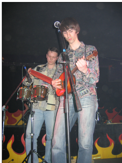
Выступление группы «Авант Гвардэ»

Московская студенческая весна была ознаменована проведением ежегодного фестиваля студенческого творчества «Фестос». Что такое Фестос? Ответ на этот прост. Фестос – это Фестиваль Фестивалей, где каждый студент, занимающийся творчеством, может проявить себя. Фестос – это ураган песен и танцев, легкий бриз классической и торнадо рок-музыки, фонтаны художественного чтения и фольклорных мотивов, залпы КВНовских шуток и эстрадных миниатюр. Сегодня Фестиваль включает в себя 16 номинаций, среди которых, Весенний кубок КВН, Весенний студенческий бал, Студенческая бардовская песня, Студенческий