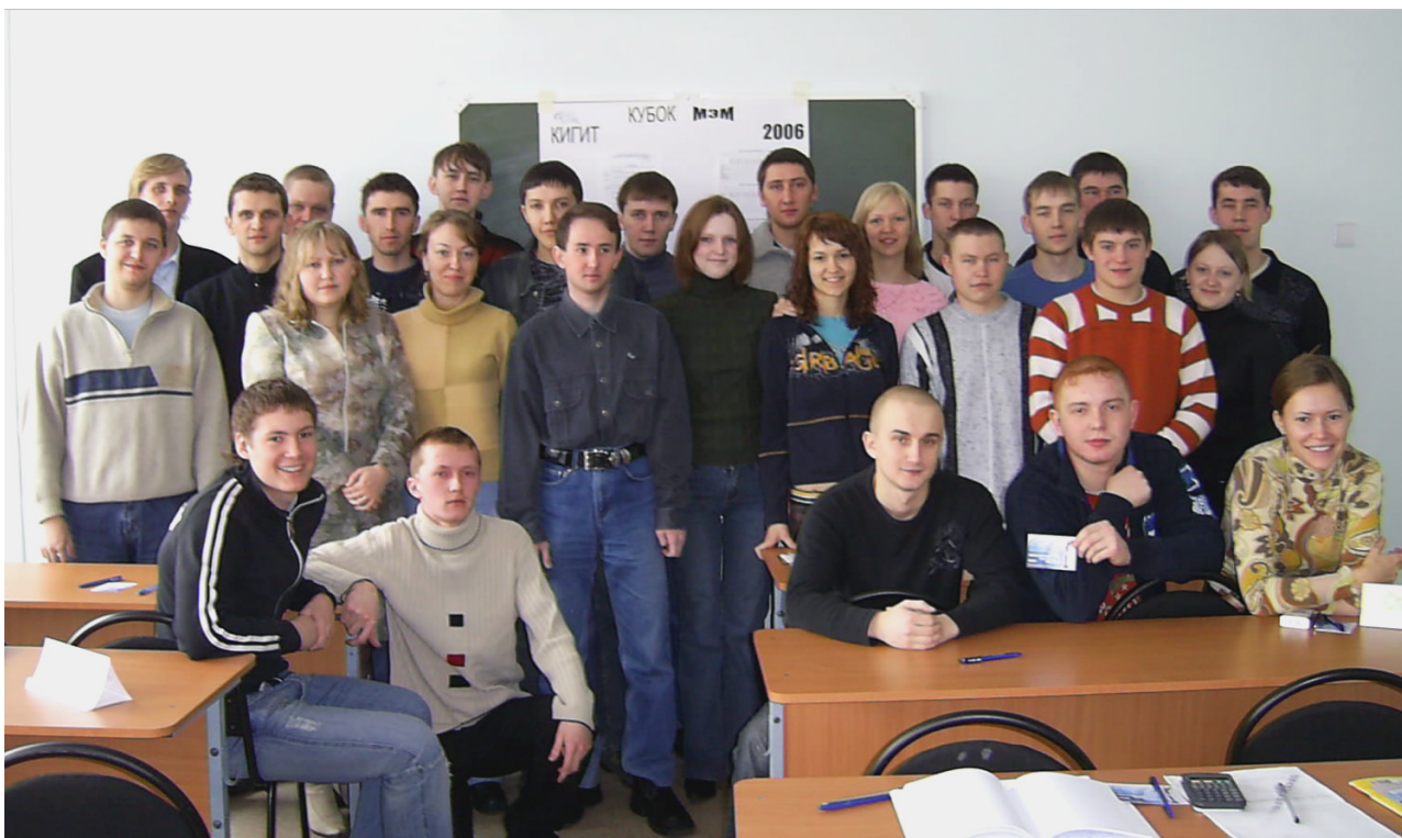
Участники Кубка МЭМ

У нас было 2 подгруппы в 1/2 финала. Из них 6 команд попали в