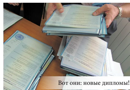
Вот они: новые дипломы!