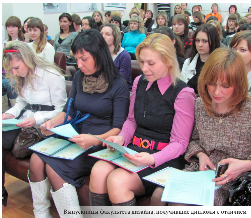
Выпускницы факультета дизайна, получившие дипломы с отличием