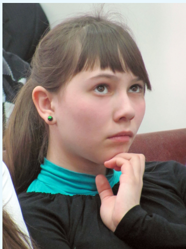
Кажется, есть вопрос...