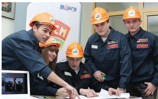
Участники студотрядов могут работать на строительстве БелАЭС

Бойцы студенческих педагогических отрядов за летний период 2010 года занимались воспитанием около полутора миллионов детей и подростков. В год 65-летия Великой Победы, по инициативе межвузовского педагогического отряда Барнаула «Аврора», был сформирован Всероссийский студенческий педагогический отряд «Победа».