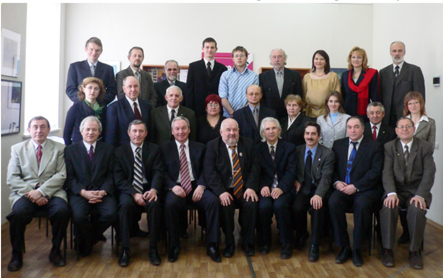
Заседание Ученого Совета «Итоги работы комиссии Рособрназзора по комплексной оценке КИГИТ, 2006»

Результаты научных исследований выходят в свет в виде монографий, методических разработок, учебников и учебных пособий. В институте осуществляется активная издательская деятельность. С 2007 года выпускается новый литературно-публицистический журнал «Италмас» и электронный исторический журнал «Иднакар».