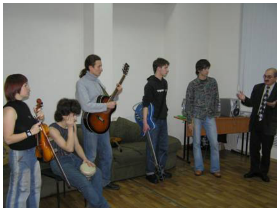
На фото: конкурс бардовской песни