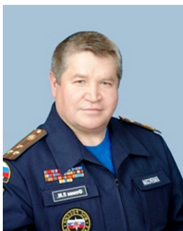
Фомин Петр Матвеевич Начальник ГУ МЧС России по Удмуртской Республике, полковник

От имени Главного управления МЧС России по Удмуртской Республике и от себя лично поздравляю Вас и в вашем лице весь коллектив Камского института с 15-летием со дня создания!