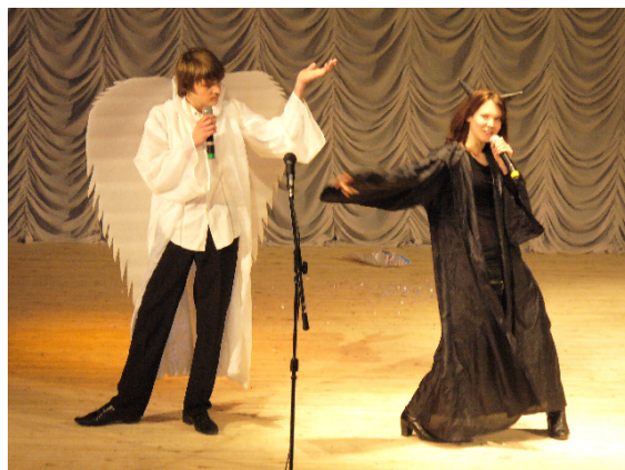
На фото: Фестиваль «Мы против наркотиков»

Стабильность существования и востребованность института в сфере образования подтверждается растущим количеством студентов. Приведём фрагмент из интервью президента КИГИТ: «Если в 2002 нас